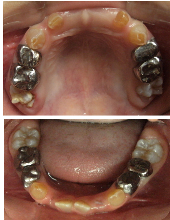
Figura 6: Postoperatorias clínicas maxilar superior e inferior año 2010.

las lesiones de caries con ionómero vítreo (Figura 6). Cuando se observó la erupción del 4.1 y 3.1, y de los 4 molares permanentes, se realizaron 3 aplicaciones de barniz de fluoruro de sodio al 5%, cumpliendo con los protocolos establecidos.