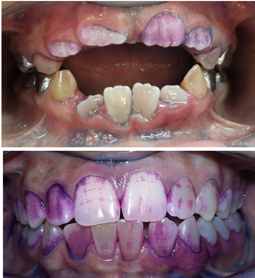
Control de placa bacteriana con revelador doble tono