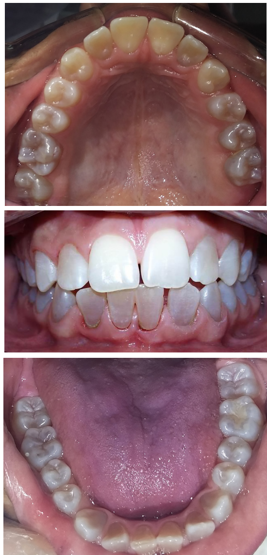
Figura 11: Controles clínicos 2018