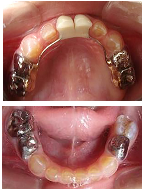
Figura 4: Postoperatorias clínicas del maxilar superior e inferior (2007)

dentarios afectados. Se restauraron los molares primarios inferiores involucrados con coronas de acero (7.4, 8.4 y 8.5). Se realizaron las extracciones de las piezas 5.1 y 6.1 que no pudieron ser rehabilitadas, manteniendo la longitud del arco con un mantenedor de espacio fijo superior; con coronas en 5.4, 5.5, 6.4 y 6.5, y arco palatino con las piezas 5.1 y 6.1 a reponer (Figura 4). De esta manera fueron restablecidas las funciones masticatorias, fonéticas, y estéticas, asegurando el mantenimiento de la dimensión vertical perdida por la atrición y, acompañando el crecimiento y desarrollo de los maxilares. El equipo interdisciplinario de la cátedra permitió que el paciente realizara simultáneamente con su tratamiento rehabilitador la consulta con la fonoaudióloga para una óptima aceptación del mantenedor de espacio y la reeducación de la postura lingual y con la psicóloga quien manifestó que el niño presentaba un comportamiento acorde a su etapa de desarrollo evolutivo y psicoafectivo y que no presentaba