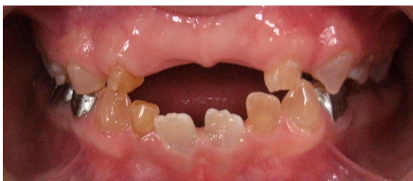
Figura 5: Examen clínico intraoral superior, sector anterior y radiografía panorámica año 2010.