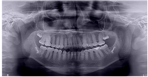
Figura 10: Rx panorámica 2018.

En el último control realizado en el año 2018 (Figura 11) el paciente mantuvo el estado de salud logrado. El análisis cariogénico fue moderado (por su historia pasada de caries y su condición biológica específica) y el gingivoperiodontal bajo. El paciente continúa en atención