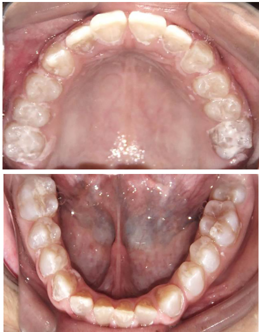
Aplicación de barniz de fluoruro de sodio