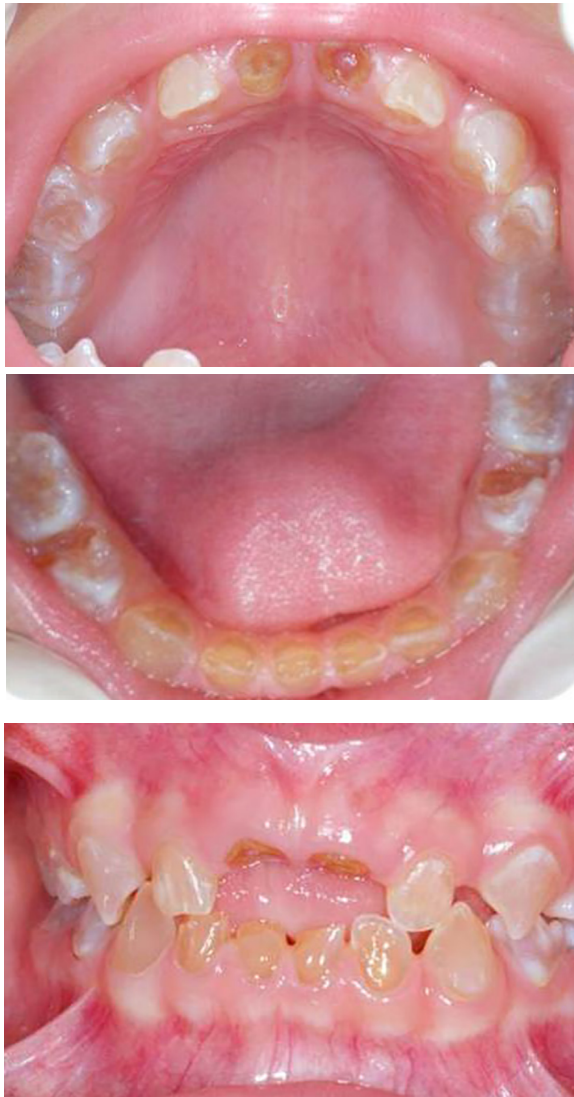
Figura 2: Examen clínico intraoral del maxilar superior e inferior y vista anterior. Año 2007