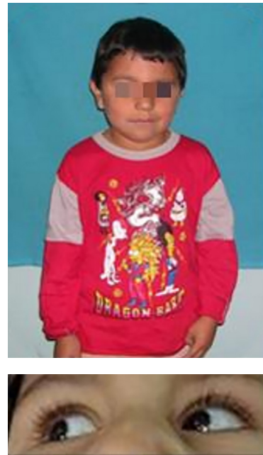
Figura 1: Examen extraoral del paciente. Escleróticas de tinte azulado

En el examen extraoral se observaron escleróticas de tinte azulado y disminución de la altura con respecto al percentilo normal. (Figura 1) Ambos padres evidenciaban talla por debajo de los valores normales, más aún su madre, con antecedentes de OI; por lo que el niño además de su enfermedad de base la OI, presentaba baja talla por su condición hereditaria. En el peso, se hallaba en los valores promedio al igual que su estado físico general, situaciones que quedaron asentadas en el resumen de su historia clínica por los médicos especialistas que lo trataban en el Hospital Garrahan, del cual vino derivado. Por su patología de base el paciente realizaba controles periódicos sin tratamiento en el mencionado hospital y fue derivado a la COIN para su atención