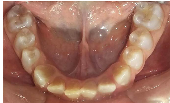
Figura 8: Radiografía panorámica (2015) y control clínico maxilar superior e inferior

En la radiografía panorámica de control del año 2015 se observó la progresiva obliteración del conducto radicular en el grupo incisivo superior e inferior y en los primeros molares permanentes; presentado los premolares en erupción, un conducto radicular anormalmente amplio en toda su longitud (Figura 8). En la del año 2018 se visualizó la continua aposición de dentina a nivel radicular que obliteró en forma casi total los conductos de la mayoría de las piezas dentarias, a excepción de los segundos molares inferiores (Figura 10).