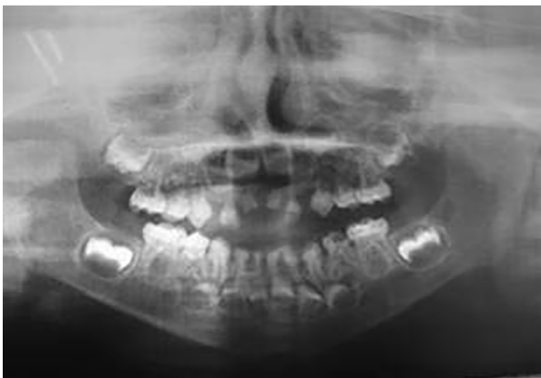
Figura 3: Radiografía panorámica año 2007

dentarios afectados. Se restauraron los molares primarios inferiores involucrados con coronas de acero (7.4, 8.4 y 8.5). Se realizaron las extracciones de las piezas 5.1 y 6.1 que no pudieron ser rehabilitadas, manteniendo la longitud del arco con un mantenedor de espacio fijo superior; con coronas en 5.4, 5.5, 6.4 y 6.5, y arco palatino con las piezas 5.1 y 6.1 a reponer (Figura 4). De esta manera fueron restablecidas las funciones masticatorias, fonéticas, y estéticas, asegurando el mantenimiento de la dimensión vertical perdida por la atrición y, acompañando el crecimiento y desarrollo de los maxilares. El equipo interdisciplinario de la cátedra permitió que el paciente realizara simultáneamente con su tratamiento rehabilitador la consulta con la fonoaudióloga para una óptima aceptación del mantenedor de espacio y la reeducación de la postura lingual y con la psicóloga quien manifestó que el niño presentaba un comportamiento acorde a su etapa de desarrollo evolutivo y psicoafectivo y que no presentaba