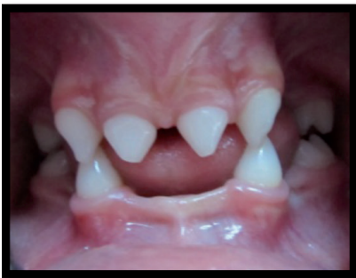
Figura 2. Oclusal de frente.