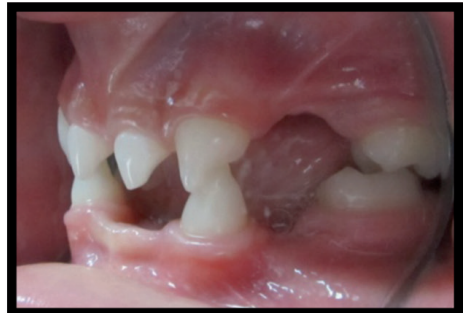
Figura 4. Lateral derecha.