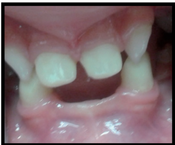
Figura 8. Formas plásticas 51-61.