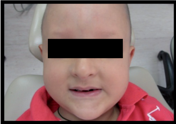
Figura 1. Primera cita.

RADIOGRAFIA PANORAMICA: Presenta dentición decidua con numerosas agenesias (oligodoncia), se observa retraso en la erupción y formas dentarias anómalas. (Figura 7)