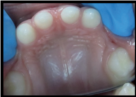
Figura 5. Oclusal superior.