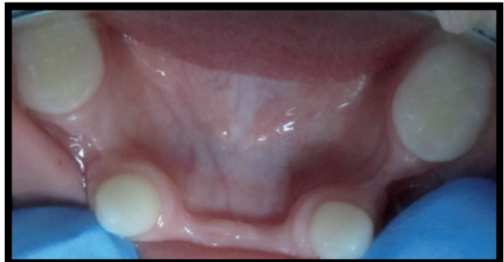
Figura 6. Oclusal inferior.