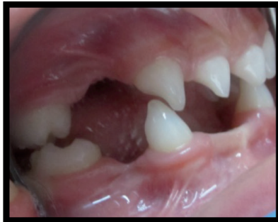
Figura 3. Lateral izquierda.