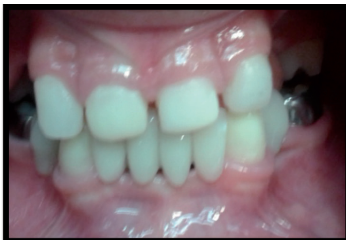
Figura 9. Forma plástica 52-52-61-62 y flipper.