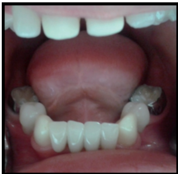
Figura 10. Flipper.Mantenedor de espacio fijo.

En junio se cementa flipper mantenedor de espacio fijo y se logra una adecuada adaptación.