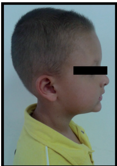
Figura 11. Foto perfil.

La madre relata que el niño psicológicamente se observa que se le facilita más la socialización en la guardería, la mamá se encuentra muy satisfecha con el resultado del tratamiento y está actualmente en la asesoría genética, mejoró en el habla y la masticación.