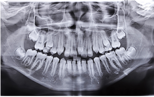
Figura 1. Radiografía panorámica donde se ve el mesiodens.

El diagnóstico de anomalías del frenillo se hace a través de un buen examen clínico y radiográfico, y el tratamiento es básicamente quirúrgico. Nuevos estudios relatan el uso de láser como tratamiento conservador en la frenectomía, minimizando los efectos posoperatorios, sin dolor, campo sin sangre y mejor pronóstico de recuperación. 13,14