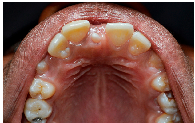
Figura 3. Ubicación del mesiodens por palatino.