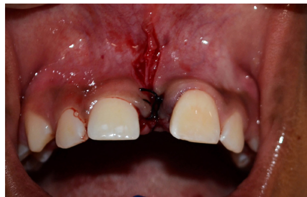
Figura 7. Pos remoción de las fibras e inicio de la sutura.

La técnica quirúrgica consistió en la antisepsia extrabucal con digluconato de clorexidina al 2%, aplicada con el auxilio de una pinza Allis y gasa estéril, haciendo movimientos circulares en toda la región peribucal y en la región del cuello. En la región intrabucal se realizó enjuague con clorexidina al 0,12%.