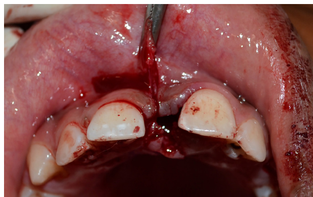
Figura 6. Frenillo sujetado con pinza hemostática y corte de las fibras externamente a la pinza.

merario, conocido como mesiodens (Fig. 1), el tratamiento indicado fue la exodoncia y la frenectomía.