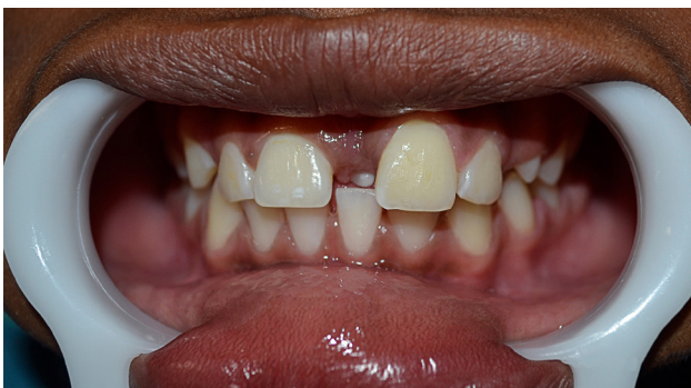
Figura 2. Mesiodens entre los incisivos centrales posteriores.

Al examen clínico, se observó gran diastema y erupción de un elemento dentario extra entre los incisivos centrales superiores (Fig. 2), en posición vertical localizado por palatino (Fig. 3). Se diagnosticó también la presencia