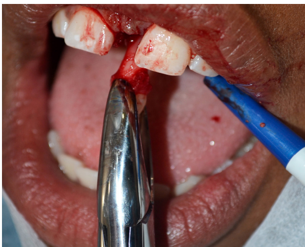
Figura 4. Avulsión del mesiodens con auxilio del fórceps n°1.

de un frenillo labial grueso, voluminoso, con producción de isquemia en la papila palatina en el momento de la tracción del labio, síntoma patognomónico del frenillo labial superior persistente. El paciente estaba transitando la segunda fase de la dentición mixta.