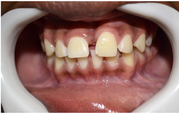
Figura 8. Nueva inserción del frenillo en la línea mucogingival, posoperatorio de 1 año.

En seguida, con la mucosa seca, se hizo anestesia tópica de la región con benzocaína al 5%, anestesia infiltrada en el fondo del vestíbulo y se realizó anestesia complementaria intraligamentosa, por mesial y distal de la posición del diente, como también en la mucosa palatina con el anestésico lidocaína al 2% con epinefrina 1:100000 (Fig. 4). El mesiodens, fue removido sin complicaciones operatorias. Luego, para la frenectomía, realizada por técnica convencional, se realizó con el bisturí nº 15 dos incisiones paralelas a lo largo de la brida formada por el frenillo labial (Fig. 5), dándole una forma de cuña, y se procedió al desplazamiento de la inserción del frenillo extirpando la banda de mucosa y periosteo. En la parte labial, el frenillo fue sujetado con una pinza hemostática y cortado en la mucosa externamente a la pinza con una tijera recta (Fig. 6). Se procedió a la divulsión con gasa estéril, lavando la herida con suero fisiológico para proseguir con la sutura de la mucosa vestibular (Fig. 7) y palatina.