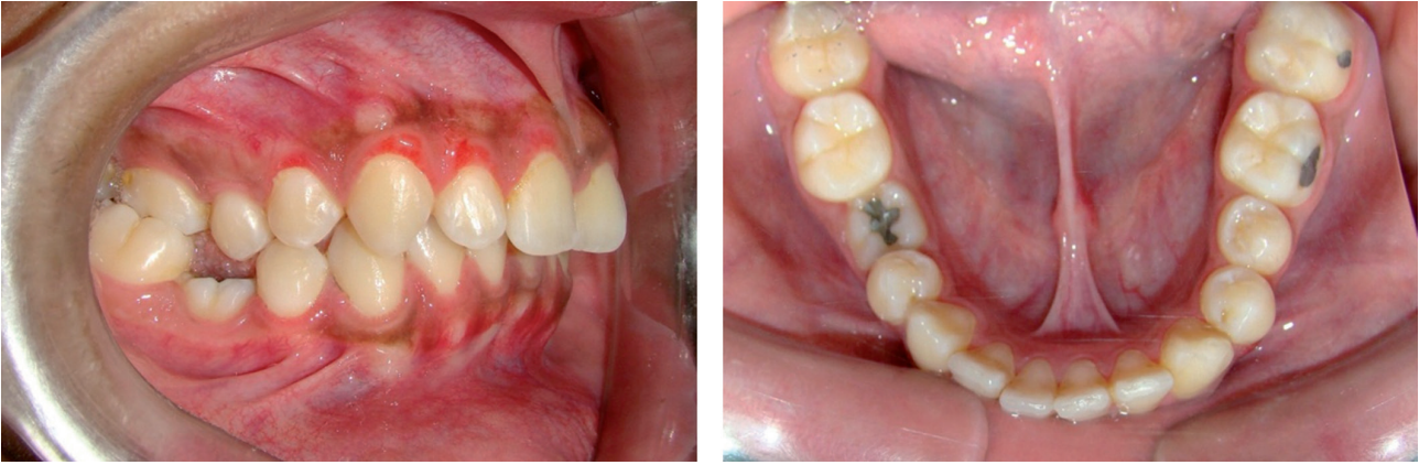
Figura 2. Infraoclusión de Molar deciduo (pieza 85) asociada a agenesia de segundo premolar inferior derecho (pieza 45).

ces mayor para las mujeres. Sus hallazgos también demostraron que el segundo premolar inferior fue el diente más afectado, seguido por el incisivo lateral superior.