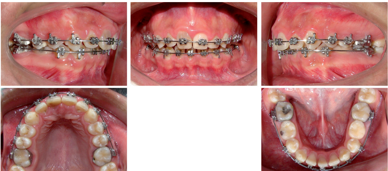
Figura 4. Manutención de los segundos molares inferiores deciduos y tratamiento de ortodoncia.

En caso se decida mantener el molar deciduo se debe de restablecer las dimensiones verticales