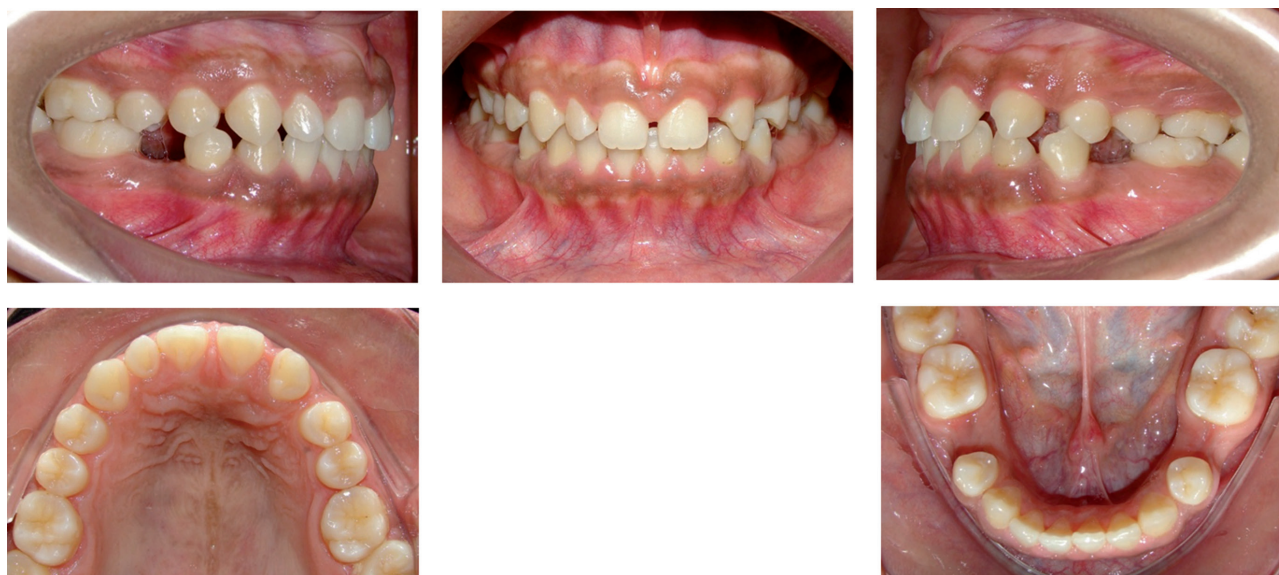
Figura 1. Agenesia bilateral de segundos premolares inferiores asociada a agenesia de incisivo lateral del lado izquierdo.

La prevalencia de la agenesia dentaria varía de acuerdo al tipo de diente involucrado. La agenesia del tercer molar es la más común con una prevalencia de hasta el 20% en las poblaciones estudiadas 17,18,19,20 . En cuanto a la segunda mayor prevalencia, se ha observado en la literatura una divergencia entre los resultados presentados. Así, para Müller et al 21 y Nik-hussein 22 , los incisivos laterales superiores representan la segunda mayor prevalencia de esta anomalía. Otros autores señalan que los segundos premolares inferiores son los siguientes dientes más ausentes 23,24,25 ( Figura 1 ). Un estudio de meta análisis publicado por Polder et al 26 parece aclarar algunos hallazgos reportados hasta la fecha, el estudio evaluó los datos obtenidos en población blanca de Norte América, Australia y Europa, sus resultados mostraron que la agenesia varía de acuerdo al continente y género; la prevalencia de ambos sexos fue mayor en Europa (hombres 4,6%; mujeres 6,3%) y en Australia (hombres 5,5%; mujeres 7,6%) que para los americanos (hombres 3,2%; mujeres 4,6%). Además, la prevalencia de la agenesia dental fue 1,37 ve-