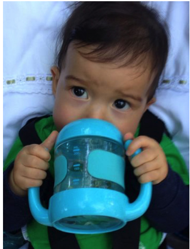
Figura 2. Uso de taza de entrenamiento.

La leche materna contiene un mayor porcentaje de lactosa que la leche bovina. Este hidrato de carbono, a pesar de tener un menor efecto cariogénico que la sacarosa, también puede promover desmineralización al encontrarse en contacto con el esmalte dental por un tiempo prolongado. La falta de conocimientos de los padres en cuanto a la necesidad de mantener una correcta higiene bucal de su hijo y sobre el potencial ca-