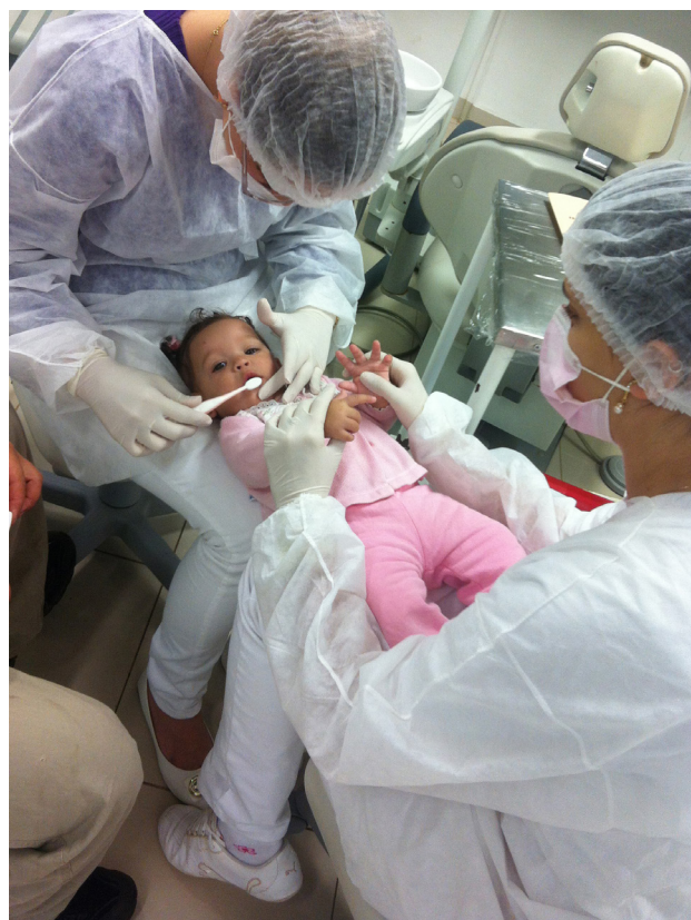
Figura 1. Técnica rodilla a rodilla para higiene bucal.

Además de los cuidados preventivos y educativos, realizados por el profesional en la consulta y diariamente por los padres, los controles periódicos son necesarios para mantener la motivación, realizar los tratamientos preventivos y clínicos en el infante. Para la realización de cual