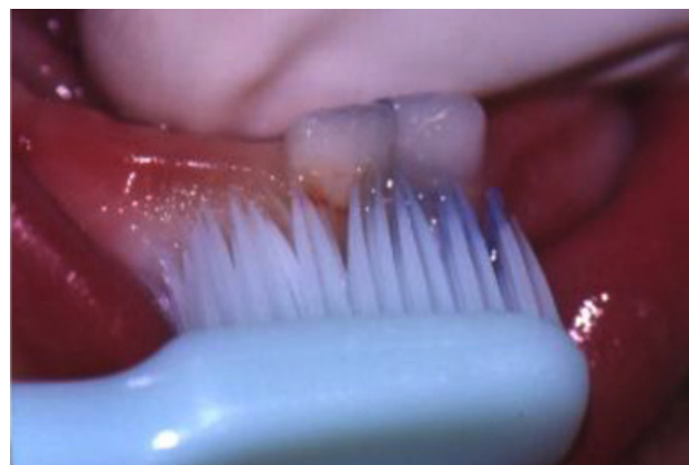
Figura 4. Cepillado de los primeros dientes deciduos.

El uso del cepillo dental se puede iniciar en el momento en el que erupciona el primer diente deciduo. (Fig. 4) El objetivo inicial del cepillado es establecer buen patrón de higiene bucal, fortaleciendo la remoción mecánica de biofilm dental de zonas accesibles. Los fabricantes de pastas dentales ofrecen una amplia gama de opciones, algunas con el objetivo específico de estimular la práctica del cepillado de los niños. Con relación a las orientaciones de los profesionales en higiene bucal en infantes, existe una interrogante latente en cuanto a cual pasta dental debe ser indicado como apoyo a los métodos mecánicos de limpieza.